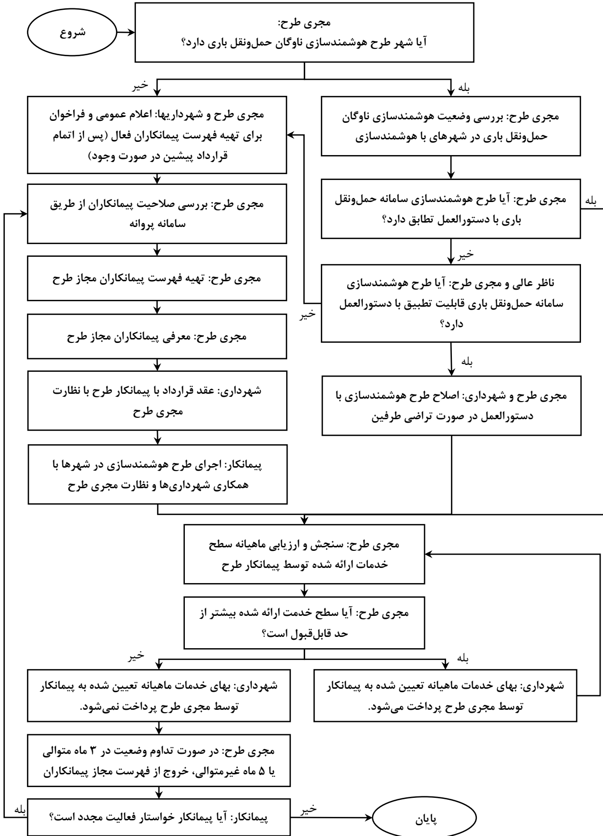
شکل (۱). فرآیند اجرای دستورالعمل هوشمندسازی سامانه حمل و نقل بار